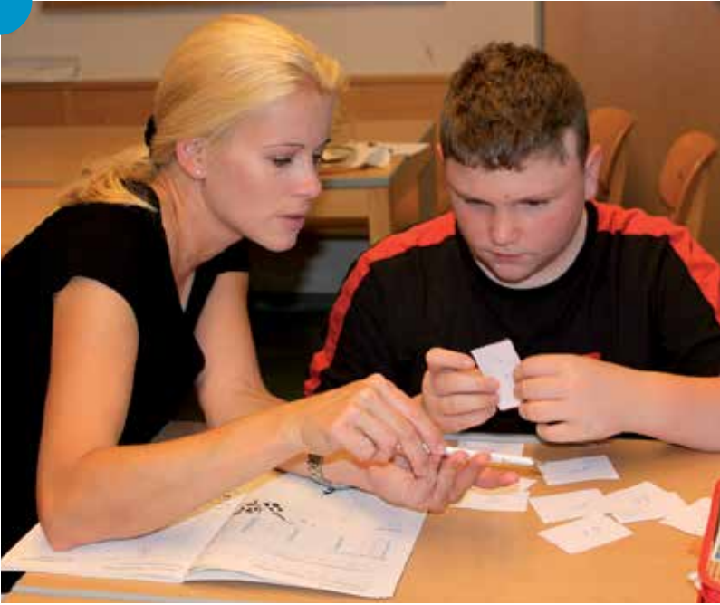
Die Assistentin ermutigt und hilft der Erinnerung auf die Sprünge.

„Von Geburt an war es nie leicht für unseren Sohn, doch er hat gekämpft und es gibt Hilfe, die so wunderbar funktioniert. Dazu gehört die Assistenz. ... Seine Assistentin bedeutet ihm alles und das ist ein Segen für uns. ... Tausend Dank, Sie wissen nicht, wie schön das für uns ist!“